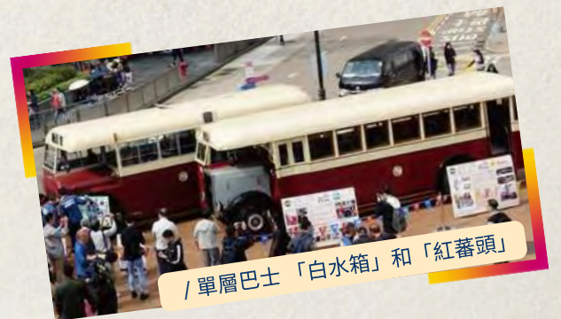
/ 單層巴士「白水箱」和「紅蕃頭」