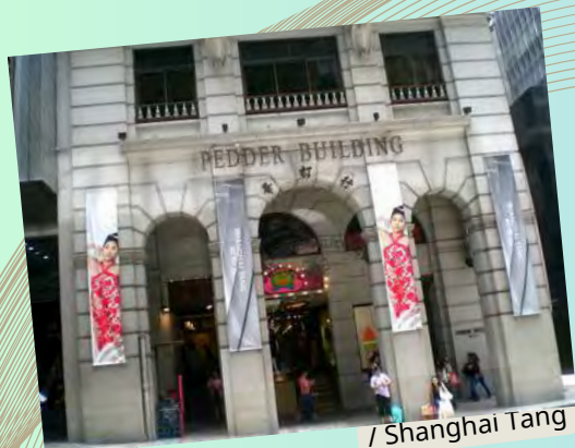
/ Shanghai Tang

不知不覺兜裏一圈站在了威靈頓街家門口, 頭天晚上還在清華園荒島邊咸豐帝跨院兒牆外推着女兒流連忘返朱子清筆下的“荷塘月色”, 今晚沒有荷塘, 獨有中環朦朧燈光月色水乳交融籠罩下櫥窗世界的陪伴。推開家門, 妻兒早已熟睡。