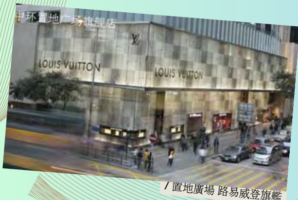
/ 置地廣場 路易威登旗艦