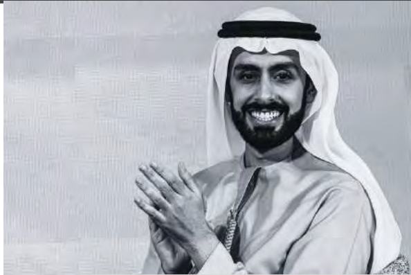
／自稱是「杜拜王子」的阿里在香港高峰會上演講