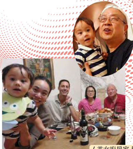
/ 美女廚房家人合照

老友姨甥女果然名副其實喜歡煮食, 其實亦非常精於食, 單看她準備的芝士頭盤, 已極盡心思, 幾款不同口味的芝士, 還有雞肝醬, 更加上火焰效果, 大有先聲奪人之勢! 跟住上枱的是大青邊鮑刺身, 配以兩、三款醬汁。青邊鮑刺身魅力非凡, 雖然刀功稍有瑕疵, 但仍是上品。