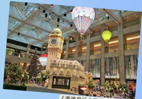
/ 香港皇后大道中 15號Dior

再往前走是德輔道中14號 置地廣場, 大庭中央設置了噴水池, 時尚高端, 環境優雅。夜幕中我常從嬰兒車中抱起女兒站在路易威登旗艦店櫥窗前, 櫥窗內的神祕景緻人物色彩頓時給兒童一個夢幻般衝擊, 女兒會停止哭鬧, 眼睛裏表露出對櫥窗造型充滿好奇, 她細細觀察沉浸在夢幻世界裏。在她的注意力專注的時候我沒有移動, 沒有離開櫥窗, 靜靜的等着她觀察出現了視覺疲勞時我把女兒放回了車裏, 走去向下一個有趣的櫥窗。