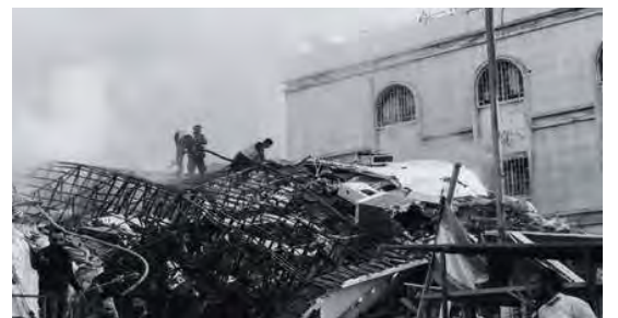
/ 被炸毀的伊朗大使館附樓

5日拜登再次向內登亞胡施壓，要他立即停止在加沙的戰鬥。7日以軍第98師從加南汗尤尼斯撤軍並稱已從加南撤出幾乎所有地面部隊，但以軍參謀長表示以軍在加沙的行動並未停止。