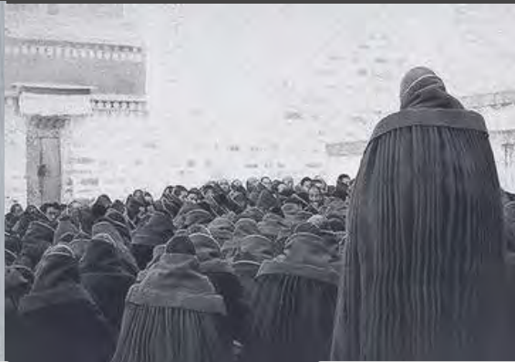
／曾經的白馬奧色法王

香港又被人溜了，前幾個月是梅西，現在是所謂的「迪拜王子」。前段時間有位名為阿里·阿勒馬克圖姆酋長殿下的尊貴「迪拜王子」到訪香港，一來就直接放大招——要在香港投5億美元成立家族辦公室！去年12月他出訪香港後，便決定設立家族辦公室，是首個海外據點。如果順利創辦，則將是迪拜王室在海外設立的第一個家族辦公室。沒想到，就在大家都以為，是「迪拜王子」帶著滿滿的錢袋子來香港的時候，事情卻突然出現了驚天反轉。