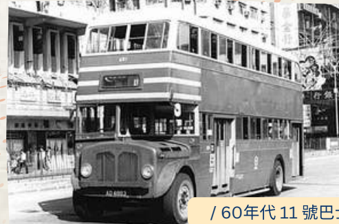
/ 60年代 11 號巴士