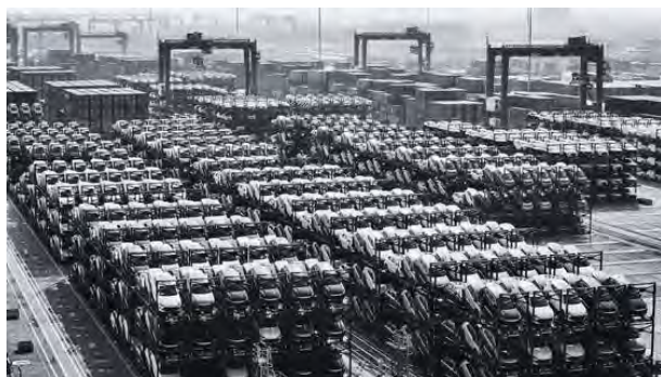
／中國江蘇省蘇州市太倉港的國際貨櫃碼頭堆放著等待裝船出口的比亞迪電動車

4月4日至9日，美財政部部長耶倫訪華。這是她上任以來第二次訪華，期間「中國產能過剩」再次受到關注。近年來，中國經濟萎靡不振，為扭轉經濟前景，北京方面正將廉價商品銷往全球，在政府引導的廉價貸款支撐下，中國企業正為海量過剩商品尋找海外買家。這是繼20多年前中國衝擊全球製造業之後又一次規模數以兆美元計的考驗。