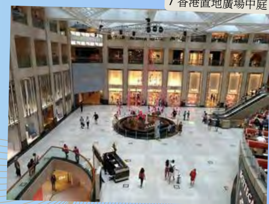
/ 香港置地廣場中庭