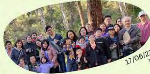
17/06/23 植樹日有四十多位華人義工參加

查詢 / 報名 : 03-9898 8832 / 0431 658 344 / rejoicecomcenter@gmail.com