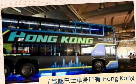
/ 氫能巴士車身印有 Hong Kong

定車隊中氫巴的佔有比例,又希望政府盡快容許氫能車使用隧道,令氫巴可投入更多路線。人類須與時俱進,期盼不久的將來,我們都能駕駛氫能汽車,讓地球空氣更清新!