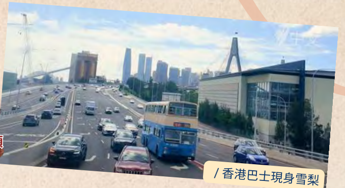
/ 香港巴士現身雪梨

2024年雪梨巴士博物館賀歲活動《香港巴士日》，一連兩個星期日順利舉行。退役香港巴士現身雪梨多個地標，《香港巴士日》也是巴士迷年度聚首的大日子。